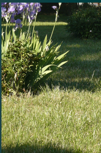
Tonte haute à 6 cm

C'est une habitude d'entretien, voire un adage «tondons court notre pelouse pour qu'elle pousse moins». Toutefois, qui a pensé à vérifier si c'était vrai ? Des décennies à tondre le gazon court alors que cette pratique a l'effet inverse de celui escompté ... Oui, tel est le cas : plus votre pelouse est tondue courte, plus elle poussera vite et sera envahie d'herbes indésirables !!