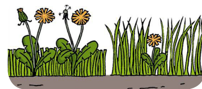
Une pelouse présente 50 % de pissenlits avec une coupe à 3,5 cm contre 1 % à 6,5 cm !

Un gazon tondu court ne peut pas faire concurrence aux « mauvaises » herbes. Les pissenlits, le trèfle et autres pourront aisément se développer au dessus du gazon. En revanche, une tonte haute freinera leurs croissances. De plus, le développement racinaire et foliaire du gazon permettra d'augmenter la pression sur les herbes indésirables et de les empêcher de s'étendre.